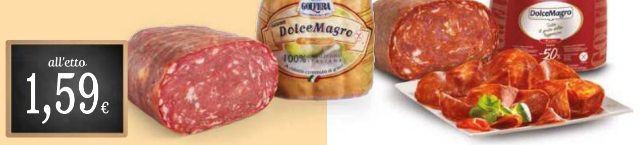
SALAME DOLCEMAGRO GOLFERA classico, piccante