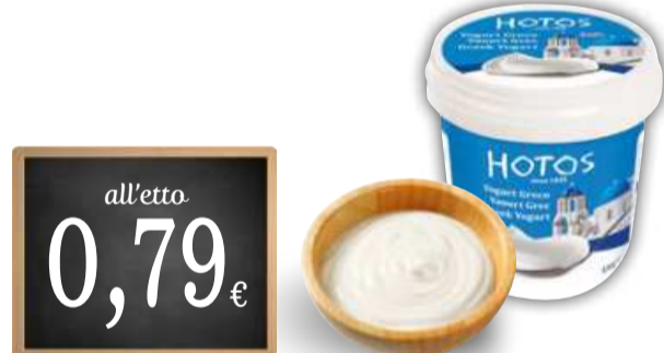
YOGURT GRECO HOTOS