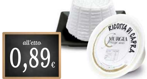
RICOTTA DI CAPRA MURGLIA