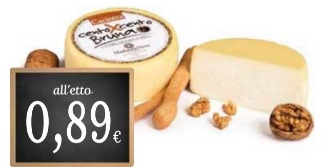
CACIOTTA CENTO X CENTO BRUNA MADONNA DELLA NEVE