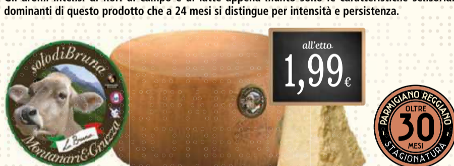
solodiBruna 30 mesi

Il Re dei Formaggi. Il Parmigiano Reggiano è prodotto nella zona tipica che comprende le province di Parma, Reggio Emilia, Modena, Bologna alla sinistra del fiume Reno e Mantova, alla destra del Po. Il legame tra Montanari & Gruzza ed il nostro amato formaggio è un legame così forte da divenire familiare. Amore che ormai si perde nel tempo. Il latte è prodotto da bovine alimentate secondo un preciso disciplinare che prevede l'utilizzo di foraggi locali e di mangimi vegetali vietando tutti i foraggi insilati e gli alimenti di origine animale. Il latte viene portato entro due ore in caseificio dalla mungitura dove viene utilizzato crudo, senza l'aggiunta di alcun additivo e senza alcun trattamento termico. Ci vogliono ben 16 litri di latte per fare un chilo di Parmigiano Reggiano. A 24 mesi il Parmigiano Reggiano raggiunge l'età ideale per essere gustato al meglio delle sue caratteristiche sensoriali.