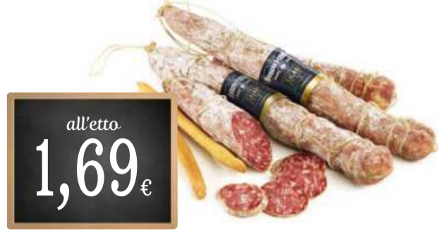
SALAME FELINO IGP BOSCHI