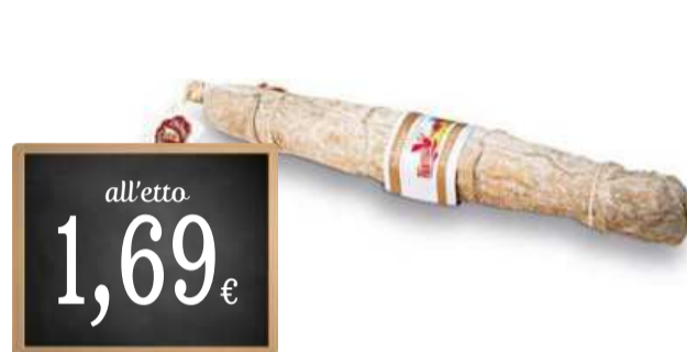
SALAME PRINCIPATO FRATELLI VI