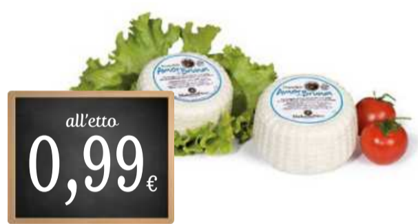
PRIMOSALE AMOR DI BRUNA MADONNA DELLA NEVE