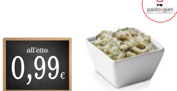
MELANZANE PICCANTI A STRISCE