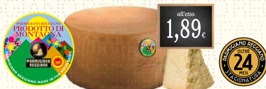
Prodotto di Montagna 24 mesi

Durante il paziente riposare delle forme di Parmigiano Reggiano sulle assi di legno per 40 mesi il formaggio matura e accresce i propri aromi. La pasta ha un aspetto più denso e friabile e la colorazione appare dorata. I piccoli cristalli bianchi che si formano nella pasta sono agglomerati di tirosina, uno degli amminoacidi essenziali liberati dal lungo processo di stagionatura. Al palato il formaggio si rivela piacevolmente croccante e si scioglie gradualmente in bocca sprigionando un gusto pieno e rotondo.